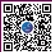
智慧零售微信公众号

主办单位：中国百货商业协会 | 中国旅游饭店业协会 | 中国照明电器协会 | 住建部·中国建筑文化中心 | 上海博华国际展览有限公司