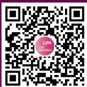
Mall 里乾坤微信公众号